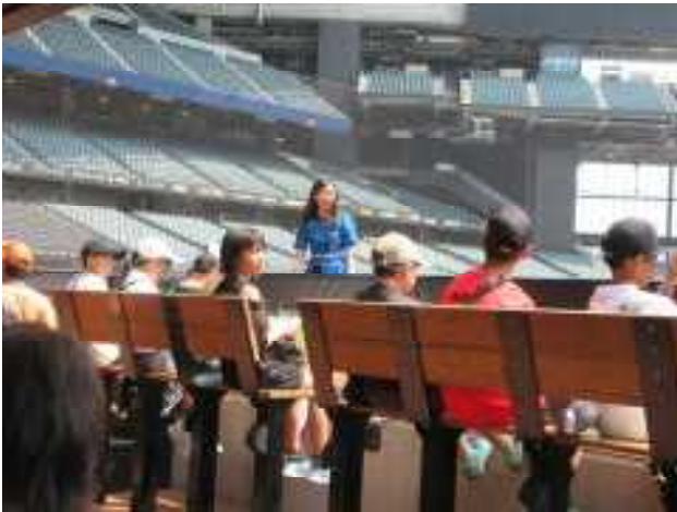
自主研修が終わり、集合場所に「テレビ父さん」

エスコンフィールド北海道では、ファイターズガールに案内をしてもらいました。 グラウンドを歩いたりファイターズベンチで新庄監督のいすに座ったりしました。