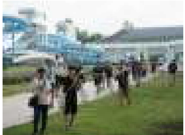
スキージャンプ台の高さと大きさに圧倒！