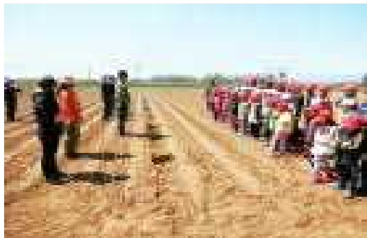
畑の先生のメークインの植え方の説明