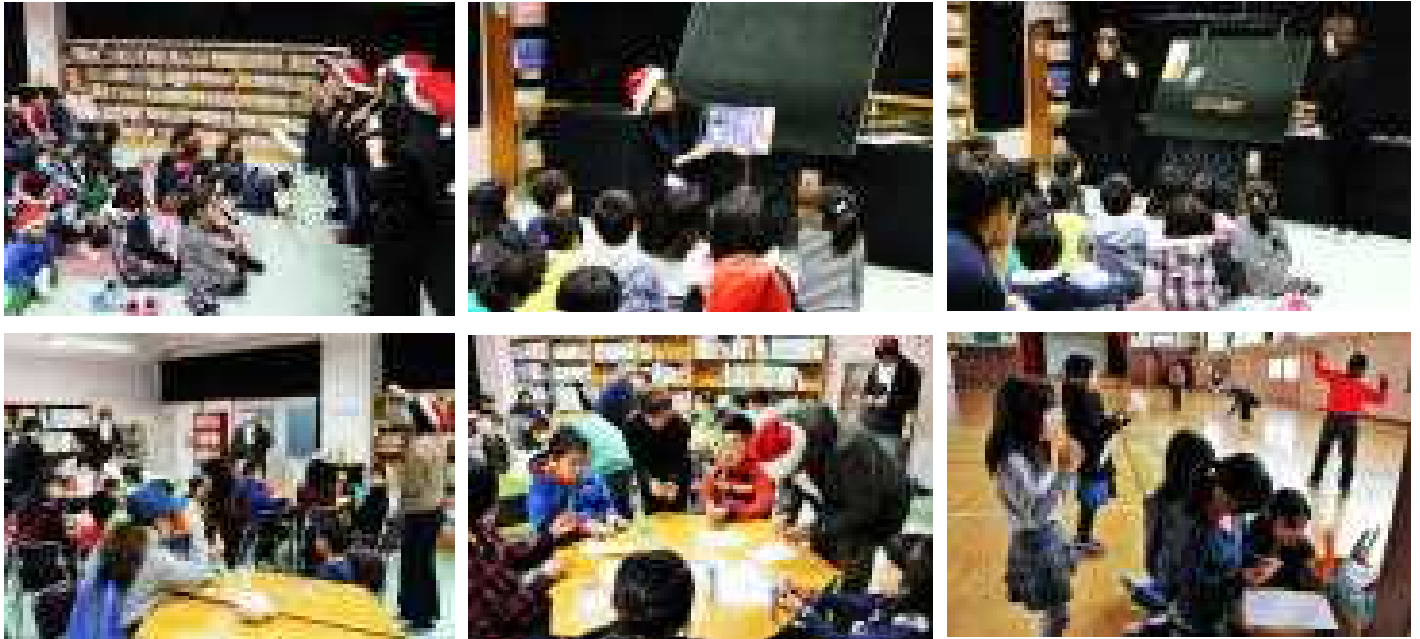
土曜体育館開放（12月16日）

～図書ボランティアの皆さんありがとうございました。～ ※同日に土曜体育館開放もありました。様子は、6枚目の写真です。