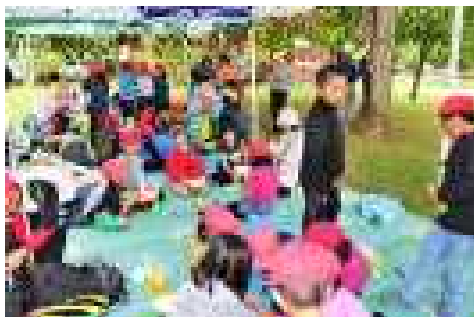
「カレーライス、おいしいね。」