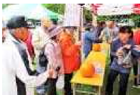
「かぼちゃはいかがですか。」