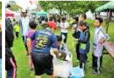
「あとかたづけは、まかしといて。」