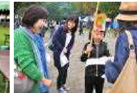
「ゴミぶくろはいかがですか。」