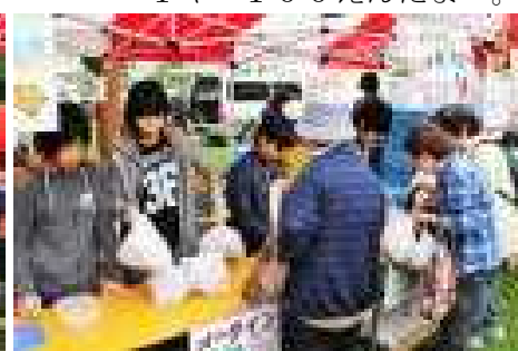
「メイクインはいかがですか。」