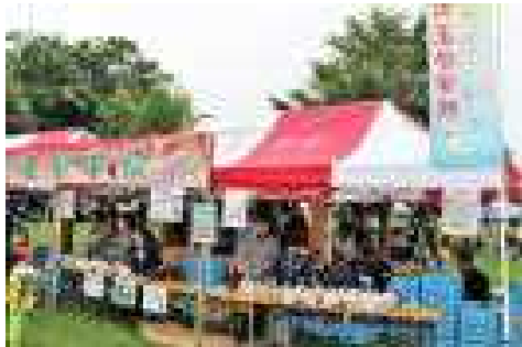
のぼりやよこまくのおひろめ。