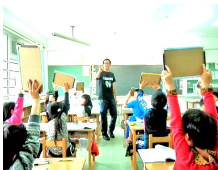
体験を想起し、発表します。

主題を追究していくにあたり、多様な交流場面を設定することで、仲間と伝え合い、高め合い、豊かに学び合う手立てとしていきます。そのため、資料からの知識や自分の考えに固執するのではなく、多様な考えに触れることで自己の生き方についての考えを深められるような授業を展開していきます。そうすることで友だちのよさを認め、他者とのつながりを実感できる学びへとつながっていくことを目指します。道徳でねらいとする価値は、児童の日常生活や他教科・多領域と密接につながっています。そうすることで、主題を自分の生活に当てはめて考えたり、自分の体験をもとにして考えたりすることができると考えます。児童の「自分だったら…」という思いを交流場面で伝え合い、学び合います。互いに学び合う姿勢が育ってくれば、友だちの発表に共感しながら聞いたり、もう一度説明してほしいところを聞き返したり、疑問をもち質問したり、自分の考えと比べて意見を述べたりするなど、他者の考えを尊重しつつ、自分の考えを深めていく姿も見ることができるようになると考えます。