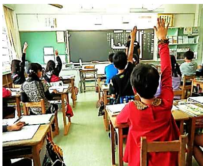
積極的に挙手し発言します。