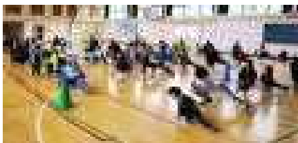
準備体操(上)、ドッジビー(右2枚) ドッジビーは意外と運動になります。

過日(6月11日(日))にPTA教養部主催のPTA交流会が行われました(60名もの参加がありました)。今年は雨天のため、体育館で「ドッジビー」(ドッジボールのボールの代わりにフリスビーで行う内容)を通して、楽しく交流を深めることを目的に実施しました。実際にやり始めると、大人も子どもも体育館フロアを駆け回り楽しむことができました。閉会後の懇親会にも多くの方々の参加をいただき、楽しいひと時を過ごすことができました。