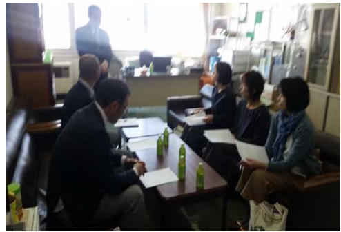
図書館活性化事業運営委員会の一コマ

今後ともよろしくお願ひいたします。お陰様で、読書好きな子どもが増えていることを実感できました。