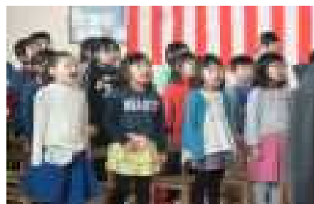
緊張した面持ちで…”スマイル”を歌う大正っ子

さあ、残すところ1日。それぞれの思いを胸に3月24日を迎えてくれることを願っています。