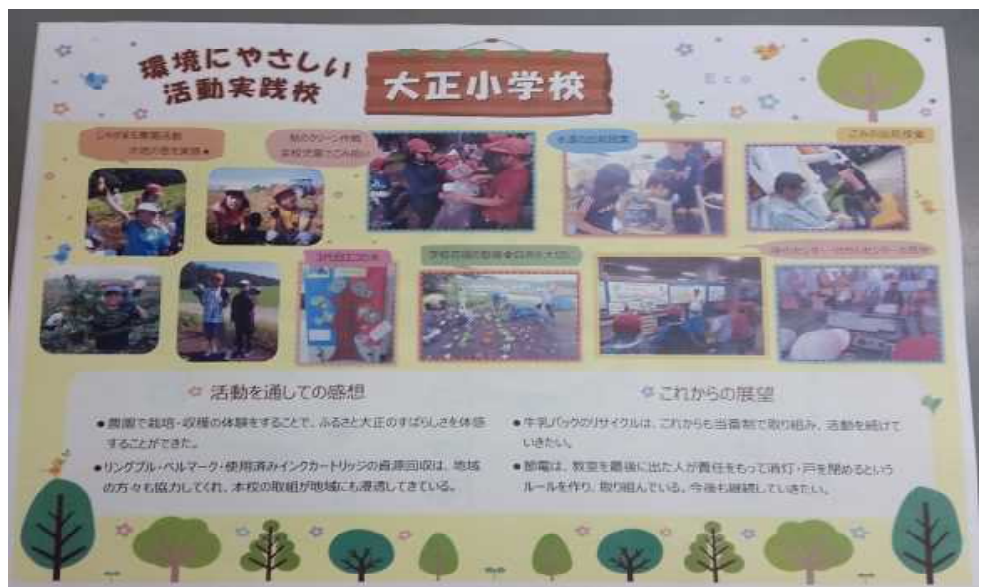
環境にやさしい実践校認定書