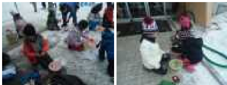
左の写真はお面づくりに向き合う子どもたちの様子を収めたものです。

子どもたち一人ひとりが思い思いに描くお面にするため、家庭から持ち寄ったグッズを一つ一つ洗面器に配置しながら、黙々と試行錯誤を重ねていました。