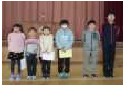
冬休みの様子と3学期の抱負を堂々と 語ってくれた学年代表のみなさん