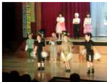
大正版キャッツ。楽しい猫たちを演じる2年生