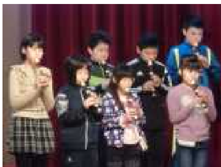
しっかりと聴かせてくれる5年生の器楽演奏