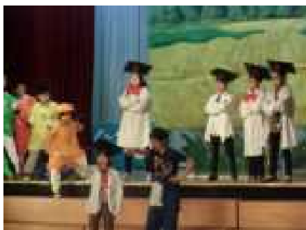
怪獣と人間の世界を熱演する4年生