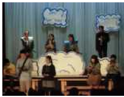
大トリを飾る6年生息の合った演技が見物です