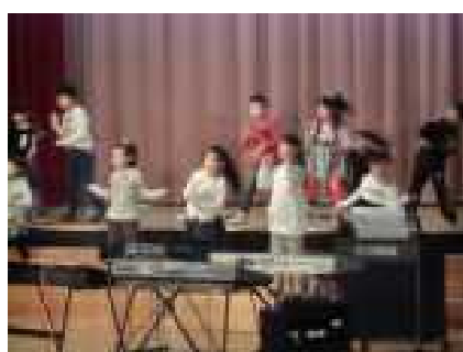
元氣よくオープニングを飾る1年生

本番さながらの衣装を纏った子どもたちが、所狭しと動き回る。歌に、ダンスに、演劇にと一生懸命な姿を見ることができました。発表会当日は、一生懸命に取り組む子どもたちの姿をご覧ください。