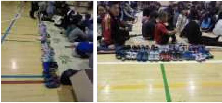
きちんと揃えられた上靴たち。子どもたちの心がよく表れています

左の写真は総練習の一コマです。子どもたちは、ごぎに座って練習に参加していました。子どもたちの上靴のつま先部分は、あっちを向き、こっちを向くなどまとまりがなく、乱雑に置かれていました。