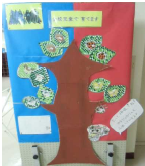
児童玄関にお目見えした