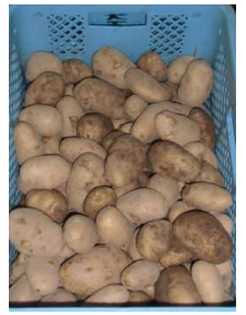
メークイン収穫活動の一コマ (1・2・6年) 大地の中から顔出す大正っ子。最高の笑顔が弾けます!!