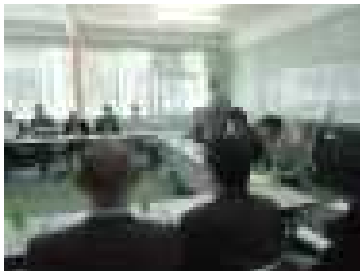
写真は、スクールバス運営委員会の様子を収めたものです。早朝より26名の方々の出席をいただきました。