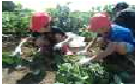
写真は昨年度の収穫作業の様子を収めたものです。